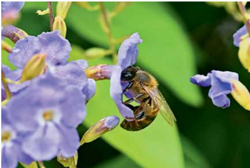
A belha-melífera ( Apis mellifera ) está entre os polinizadores mais comuns e abundantes encontrados no mundo.

pólen, néctar ou até óleos e resinas. Além disso, abelhas tendem a exibir o comportamento de visitar as mesmas espécies de flores em um mesmo voo de forrageio, aumentando sua importância como polinizadores.