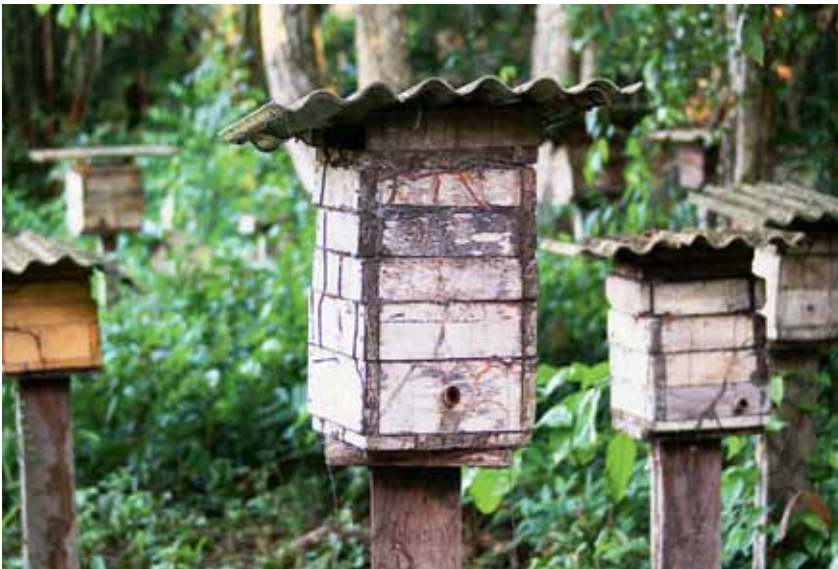
Caixa racional de abelha-canudo ( Scaptotrigona ) no meliponário da Reserva Extrativista Tapajós-Arapiuns (PA).

Além do mais, caso você pretenda estabelecer muitas caixas e formar um meliponário, observe a composição de espécies nativas da sua região e outras