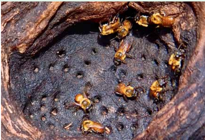
Uruçu-amarela ( Melipona paraensis ).