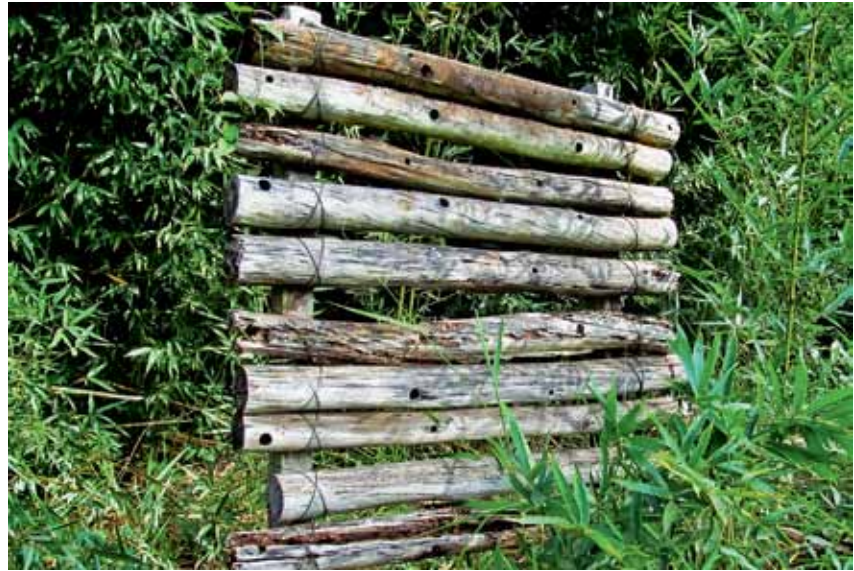
Perfurações de diferentes tamanhos em mourões de cercas e pedaços de madeira são ideias para atrair abelhas solitárias.

Áreas de vegetação periférica, como bordas de campo, cercas vivas, margens de estradas e de linhas de transmissão elétrica e matas ciliares também