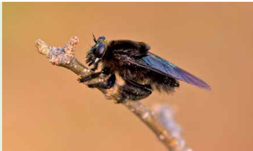
Abelha ou Mosca? A mosca-ladra (Asilidae) é uma predadora de abelhas, e por isso as mimetiza.

Mimetismo é a presença de características ou comportamentos utilizados por alguns animais que os confundem com um outro grupo de organismo. Por exemplo, o bicho-pau é confundido com um graveto em meio a um arbusto. Essas semelhanças se dão no padrão de coloração, textura, forma do corpo, comportamento e características químicas, e deve conferir ao mímico uma vantagem adaptativa contra seus predadores.