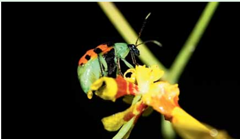
Os besouros estão entre os polinizadores mais antigos do planeta.

Abelhas, moscas e até gafanhotos visitam as flores das magnoliídeas, atraídos pela oferta de pólen e néctar, mas a maioria deles chega até a flor muito tarde, após o período em que as flores estão receptivas para polinização, deixando para os besouros o importante fardo da perpetuação desse grupo.