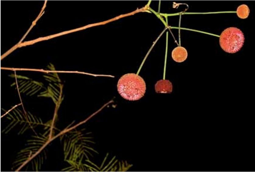
A fava-de-bolota ( Parkia platycephala ) é uma árvore encontrada no norte do Brasil e frequentemente utilizada em paisagismos. Suas flores são tipicamente polinizadas por morcegos nectarívoros.

Trocar néctar por polinização é uma transação delicada que traz um dilema para a planta. Para plantas de floração noturna é interessante que a oferta de néctar seja econômica, pois morcegos bem alimentados visitam menos flores. Por outro lado, se a planta oferecer muito pouco, o morcego prestará seu serviço em outro local. Ao longo da evolução, as plantas