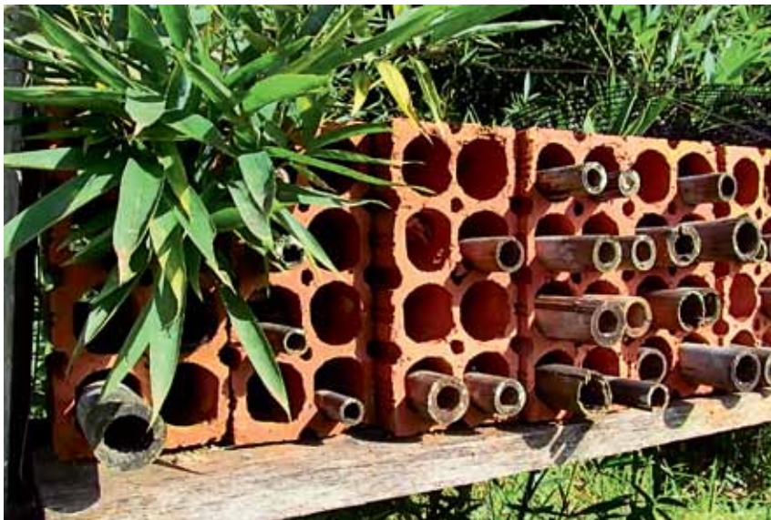
Utilizando a criatividade, diversos ninhos artificiais podem ser montados e oferecidos às abelhas, com materiais que eventualmente seriam jogados fora.

necessário garantir que partes do solo permaneçam expostas e bem drenadas, em áreas ensolaradas, livres da invasão de espécies herbáceas dominantes, como o capim, e protegidas de aração, de gradeamento e de pisoteio de gado ou mesmo de pessoas. Essas são as áreas em que os insetos irão nidificar ou depositar seus ovos e, portanto, também não devem ser queimadas, tampouco aradas, porque