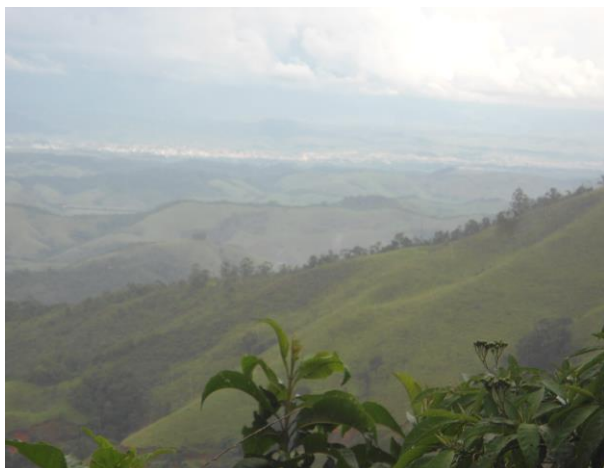
Vista do Vale do Paraíba