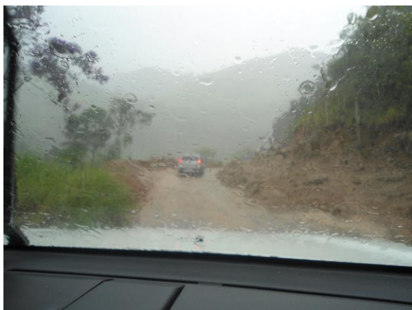
Entorno do Parque – estrada