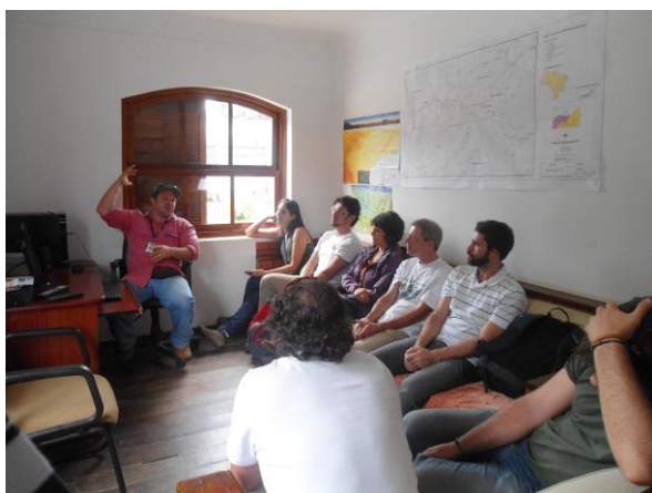
Sede do PE – local do encontro