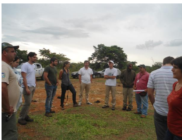
Fim da visita com a entrega dos atestados