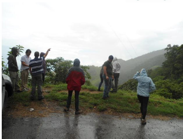
Participantes da visita técnica