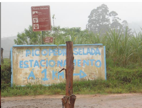
Entorno do Parque – trilha de acesso Pedra Selada