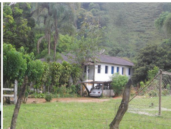
Entorno do Parque – sede de fazenda