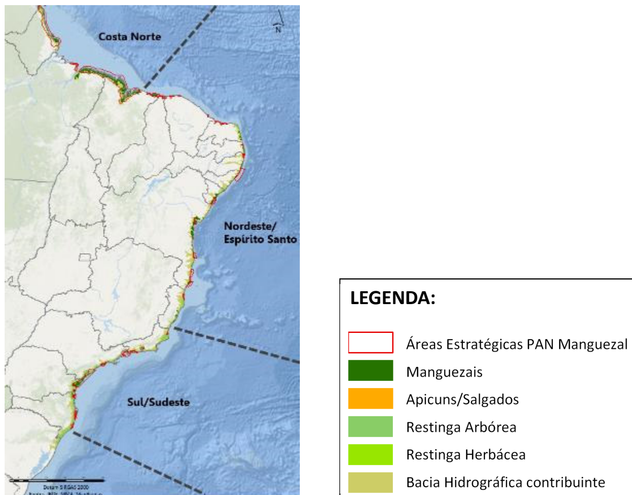
Figura 1. Áreas de manguezais, apicuns, salgados e restingas e as respectivas bacias hidrográficas contribuintes na costa brasileira, inseridas nas três Macrorregiões definidas no PAN Manguezal.

As propostas submetidas ao Edital deverão indicar se atuarão em uma ou mais de uma dessas três Macrorregiões. As proponentes deverão informar também se as áreas propostas para restauração abrangem uma ou mais de uma das 30 áreas estratégicas para conservação e manejo definidas no PAN Manguezal, delimitadas a partir dos critérios de importância social, importância biológica, oportunidade, efetividade de conservação, ameaça e representatividade regional e apresentadas na Figura 2 .