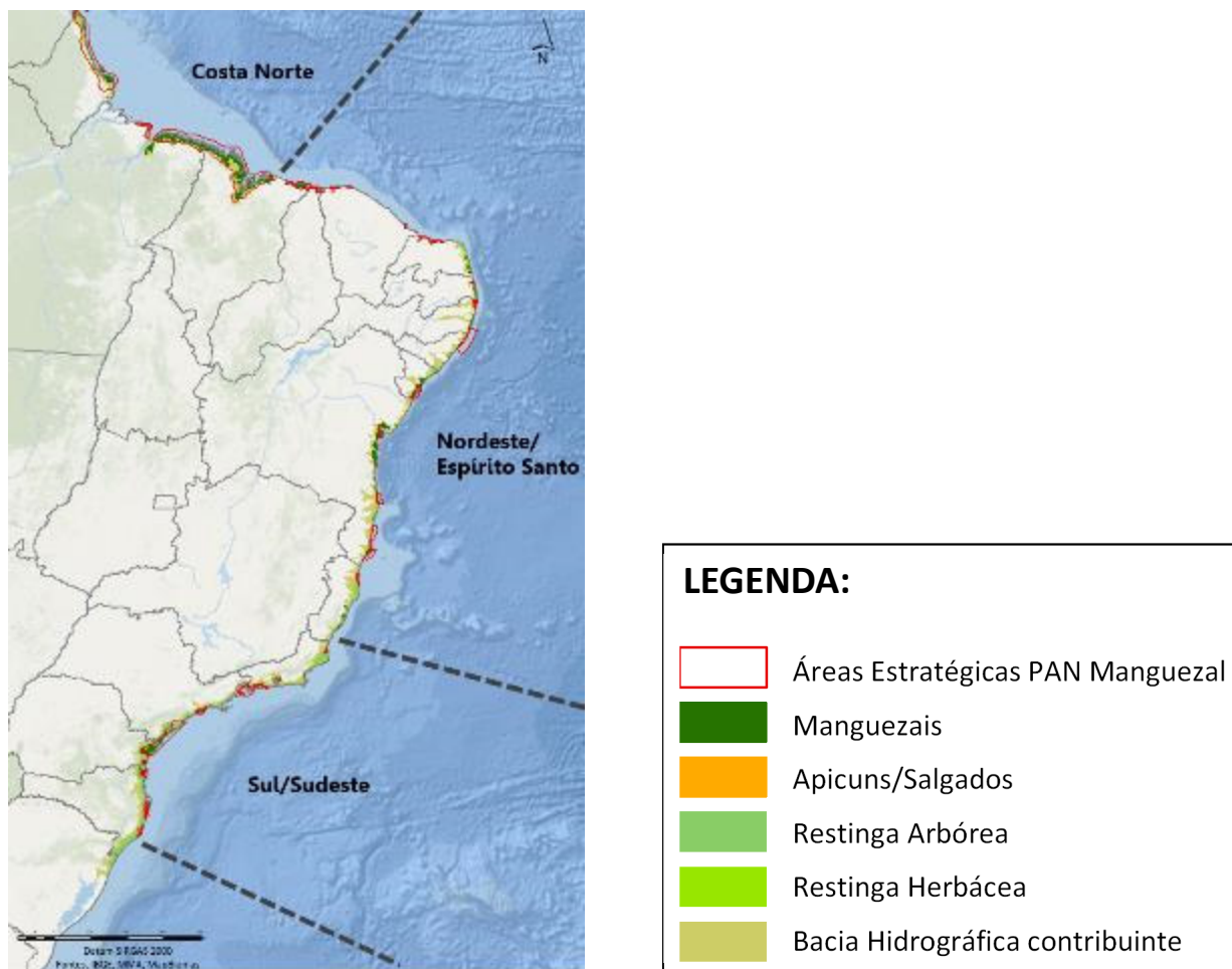
Figura 1. Áreas de manguezais, apicuns, salgados, restingas e as respectivas bacias hidrográficas contribuintes na costa brasileira, inseridas nas três Macrorregiões definidas no PAN Manguezal.

As propostas submetidas ao Edital deverão indicar se atuarão em uma ou mais de uma dessas três Macrorregiões. As proponentes deverão informar também se as áreas propostas para restauração abrangem uma ou mais de uma das 30 áreas estratégicas para conservação e manejo definidas no PAN Manguezal, delimitadas a partir dos critérios de importância social, importância biológica, oportunidade, efetividade de conservação, ameaça e representatividade regional e apresentadas na Figura 2.