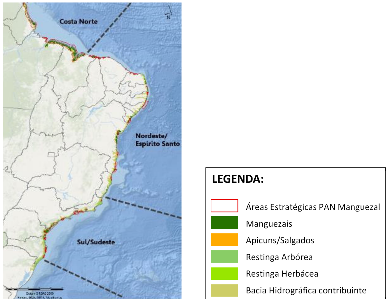
Figura 1. Áreas de manguezais, apicuns, salgados, restingas e as respectivas bacias hidrográficas contribuintes na costa brasileira, inseridas nas três Macrorregiões definidas no PAN Manguezal.

As propostas submetidas ao Edital deverão indicar se atuarão em uma ou mais de uma dessas três Macrorregiões. As proponentes deverão informar também se as áreas propostas para restauração abrangem uma ou mais de uma das 30 áreas estratégicas para conservação e manejo definidas no PAN Manguezal, delimitadas a partir dos critérios de importância social, importância biológica, oportunidade, efetividade de conservação, ameaça e representatividade regional e apresentadas na Figura 2 .