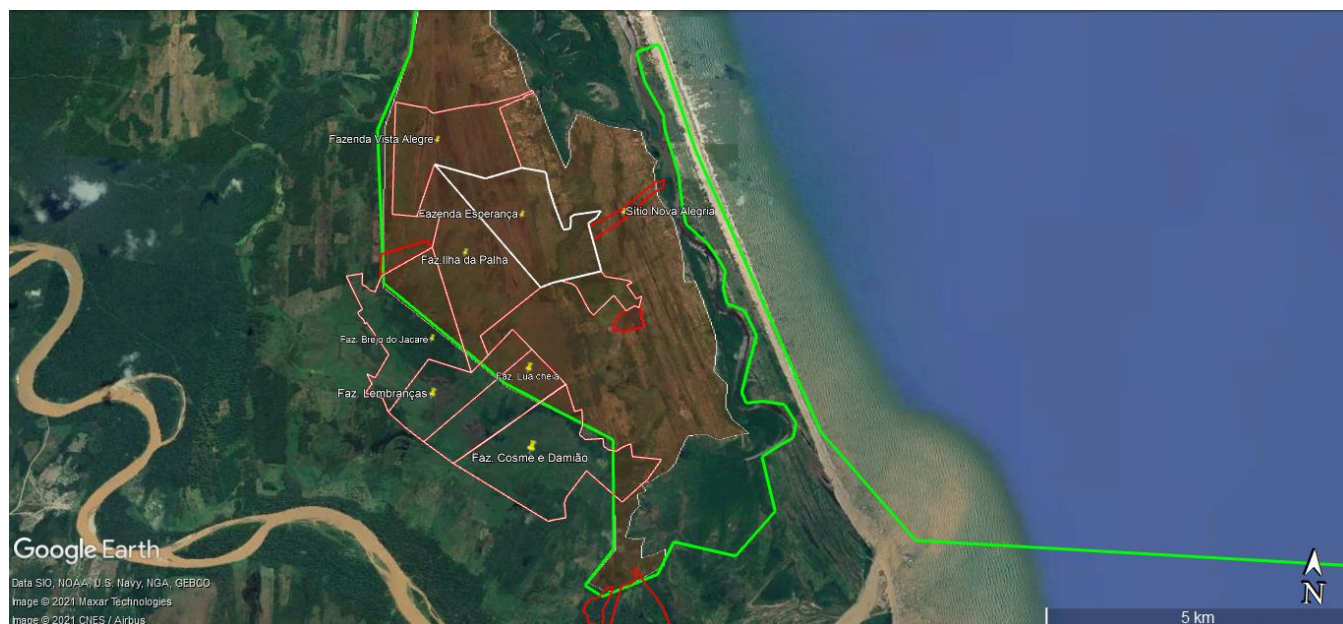
Figura 03: mapa de parte da RESEX de Canavieiras com destaque para área sem CCDRU e com áreas que possuem CAR/CEFIR registrados no site do INEMA-BA.

Consiste em levantar e analisar a documentação imobiliária, necessária à instrução processual com base na Instrução Normativa ICMBio nº 04/2020, correspondente aos imóveis (posses, usos ou domínios) das áreas mostradas na imagem. Trata-se de fazendas identificadas na região fora do CCDRU de acordo com o sistema CAR/CEFIR do Estado da Bahia. Mais detalhes dos imóveis (nomes dos proprietários, nomes dos imóveis e demais informações que o ICMBio possuir) serão repassados aos consultores após contratação.