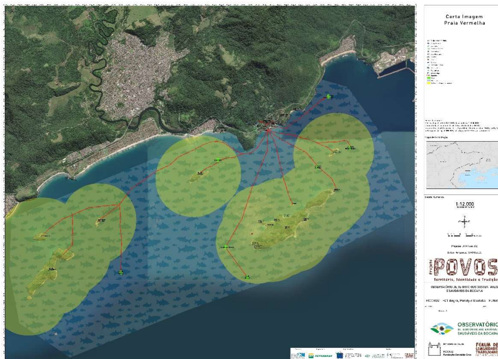
Figura2: Carta imagem dos pesqueiros utilizados pelos pescadores artesanais da Praia Vermelha sobrepostos às áreas da ESEC Tamoios (em verde).