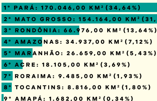
Figura 1 — Taxas de desmatamento acumulado na Amazônia Legal.

Os dados de 2024 constantes na plataforma apontam um significativo acúmulo nos estados do Pará, Mato Grosso e Rondônia, sendo que o primeiro vem apresentando um decréscimo significativo nas taxas de desmatamento a partir de 2021.